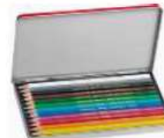
des crayons de couleurs