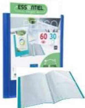
3 porte-vues de 120 vues personnalisables, couvertures rigides et solides 1 bleu, 1 vert, 1 rouge