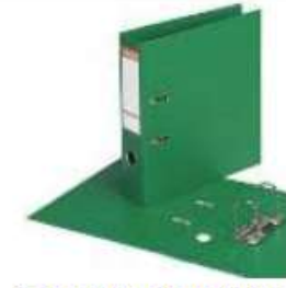
1 classeur grand format rigide à levier avec 2 anneaux et dos de 5 cm