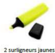
2 surligneurs jaunes