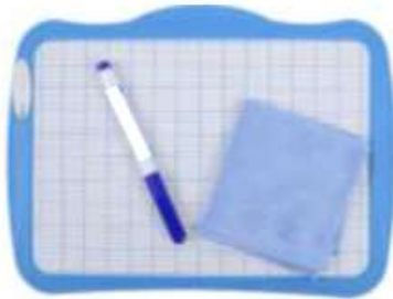
1 ardoise blanche + 1 chiffon/effaceur