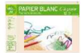
1 pochette de papier blanc à grains A4