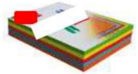
1 ramette de papier couleurs A4