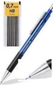
1 porte-mine 0,7mm + des recharges