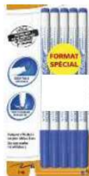
10 feutres d'ardoise fins