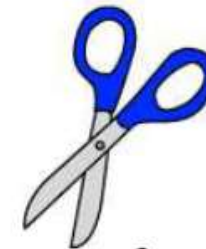
1 paire de ciseaux 17 cm environ droitier ou gaucher