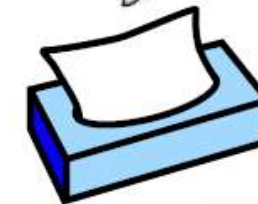
3 boîtes de mouchoirs