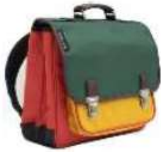
1 cartable sans roulette facile à ouvrir et à refermer