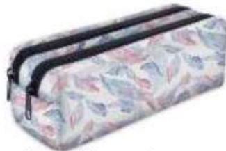
1 trousse à 2 compartiments