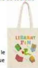
1 sac en tissu pour le livre de bibliothèque