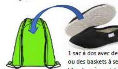
1 sac à dos avec des patins ou des baskets à semelles blanches, à scratch