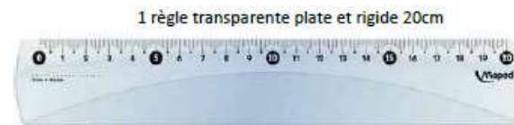
1 règle transparente plate et rigide 20cm