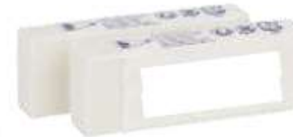
6 gommes blanches