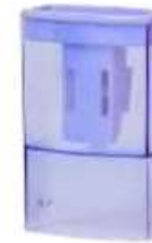
1 taille-crayon avec réservoir