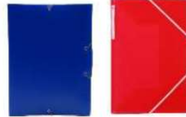
2 pochettes de rangement à élastiques 3 rabats A4 plastique, 1 bleue et 1 rouge