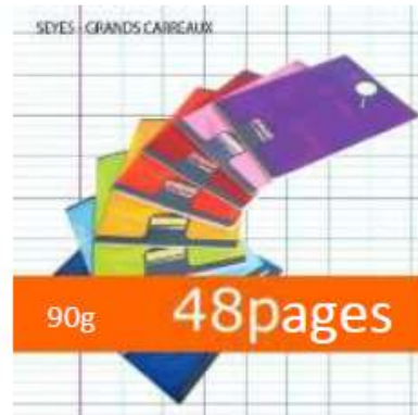
10 cahiers 17x22cm